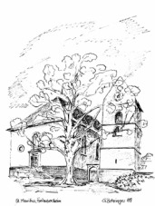
St. Mauritius Frei-Laubersheim