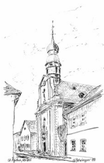
St. Josef und Ägidius –Fürfeld Tiefenthal