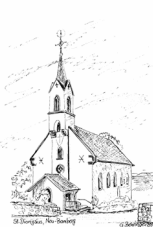
St. Dionysius Neu-Bamberg