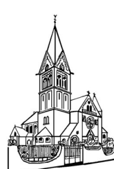
St. Remigius Wöllstein mit Eckelsheim + Gumbsheim