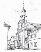
St. Josef u. St. Ägidius

Wir wünschen einen guten Weg durch die Österliche Bußzeit! Ihr Pfarrbüro!