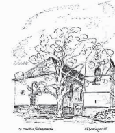
St. Mauritius u. Gefährten